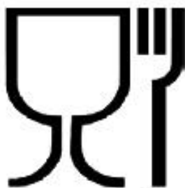
Рисунок А.1 - Для пищевых продуктов

А.2 Символ и знаки, наносимые на изделия и/или упаковочный ярлык, характеризующие бутылки по назначению, - см. рисунки А.1 и А.2.